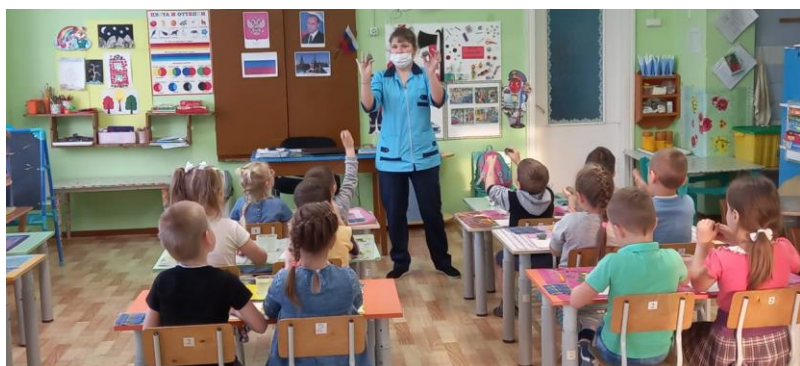
Фото занятия лепки «Дымковский петушок из глины»