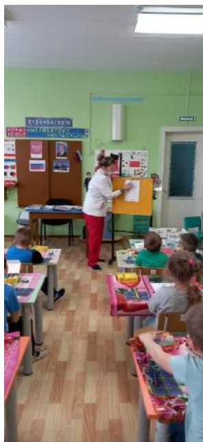
Фото занятия «Роспись Дымковской барышни».