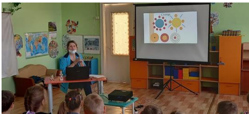
Фото занятия «Беседа о дымковской игрушке»