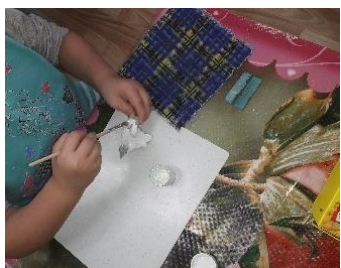
Фото занятия декоративного рисования «Роспись дымковского петушка».