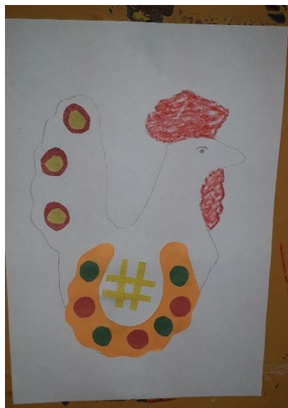
Фото занятия «Дымковский петушок аппликационным способом».